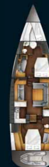
2 cabines / 2 cabins option