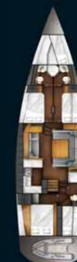
4 cabines / 4 cabins option