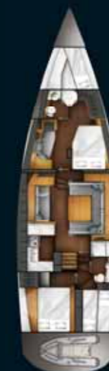
Cabine propriétaire avant / With owner's forward cabin option