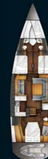
Cabine propriétaire arrière / With owner's aft cabin option

The Pilot Saloon 58 is available in different interior configurations : 2, 3 or 4 cabins, forward or owner's cabin, skipper cabin or sail locker... Different lay-outs for a unique yacht.