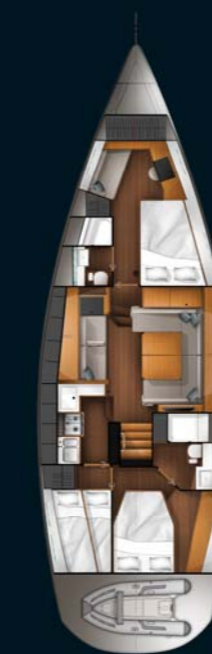
Cabine du propriétaire avant With owner's forward cabin option