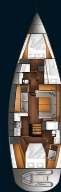
Cabine du propriétaire arrière With owner's aft cabin option